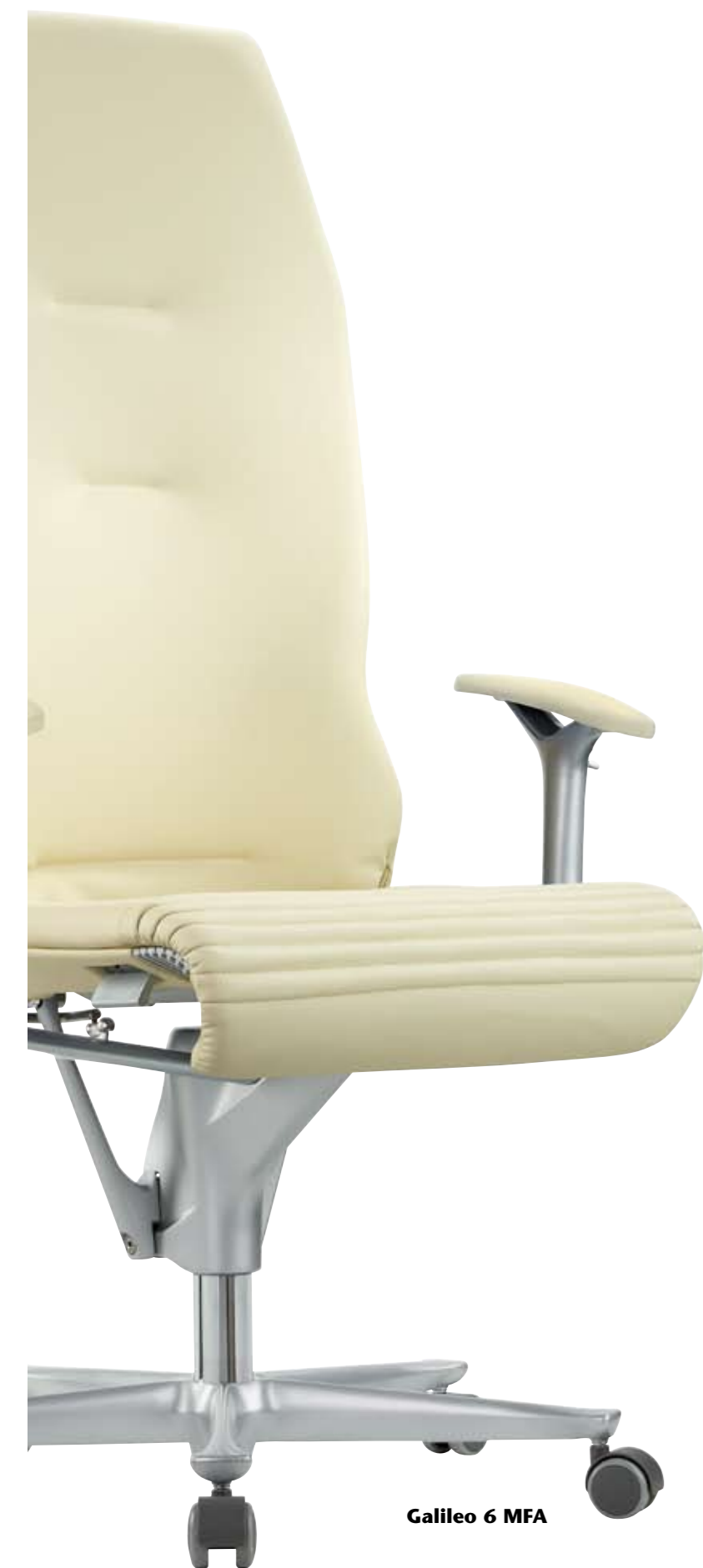
Galileo 6 MFA