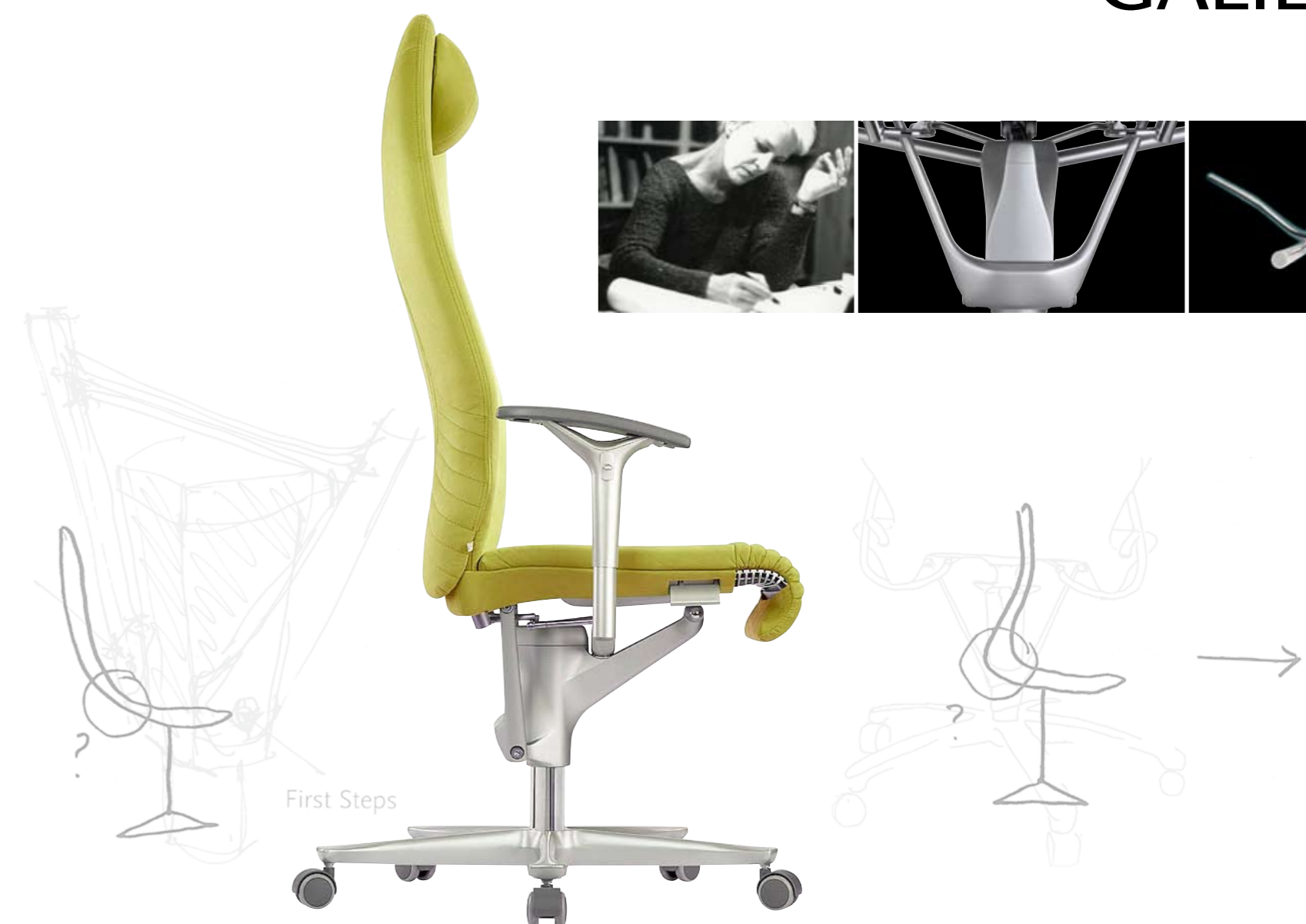
Galileo 8 MFA