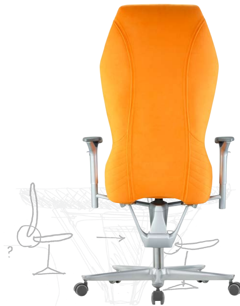
Galileo 6 MFA