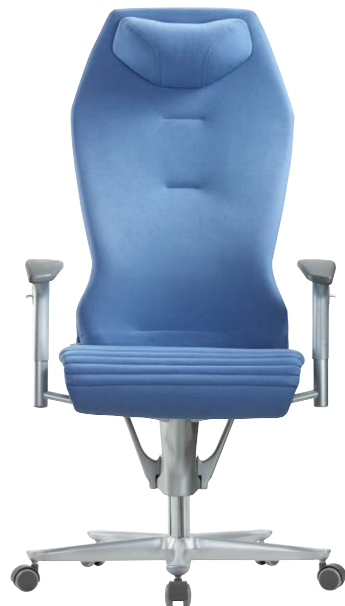
Galileo 8 MFA